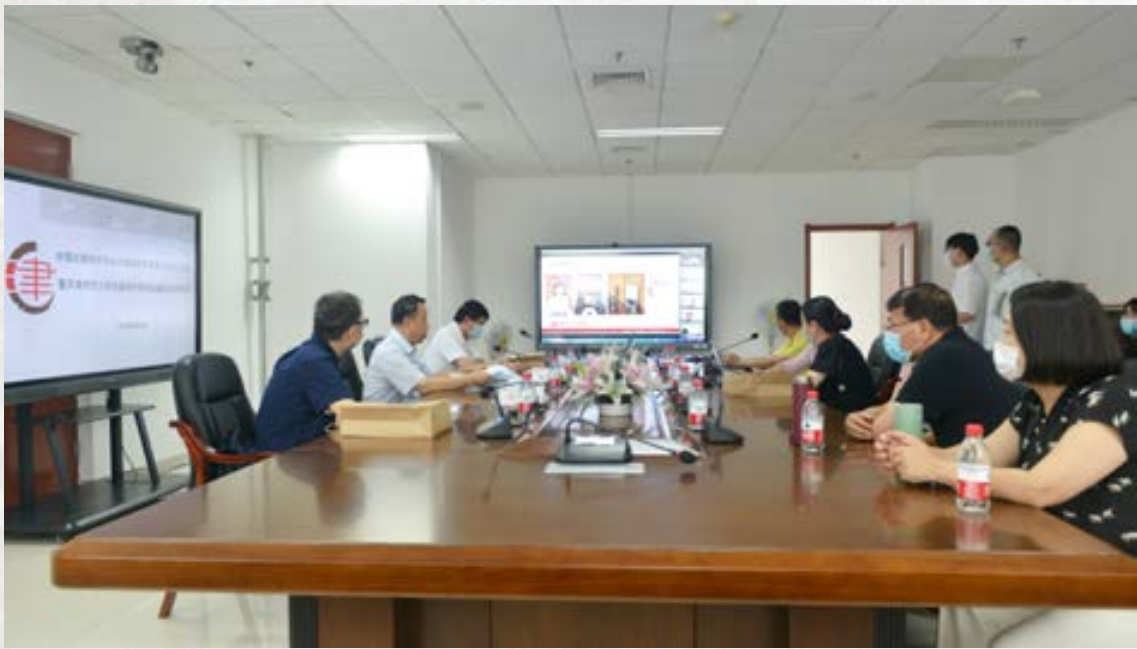
天津师范大学分会场