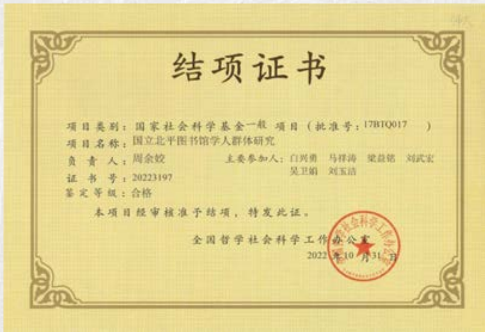
国家社会科学基金一般项目《国立北平图书馆学人群体研究》结项证书