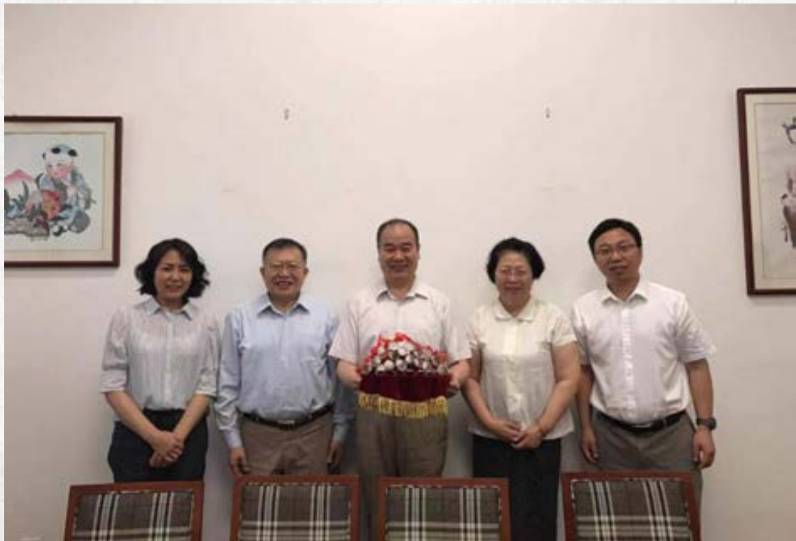
国家图书馆分会场领导合影