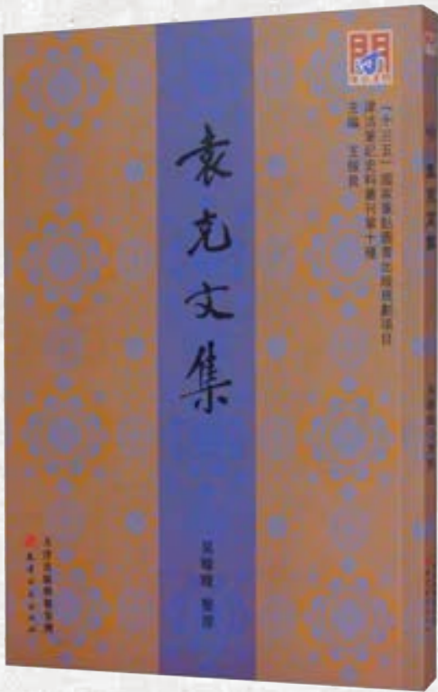
问津文库（王振良主编）