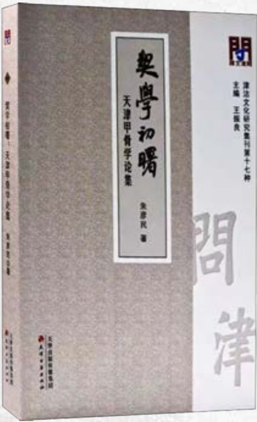
天津甲骨学论集（王振良主编）