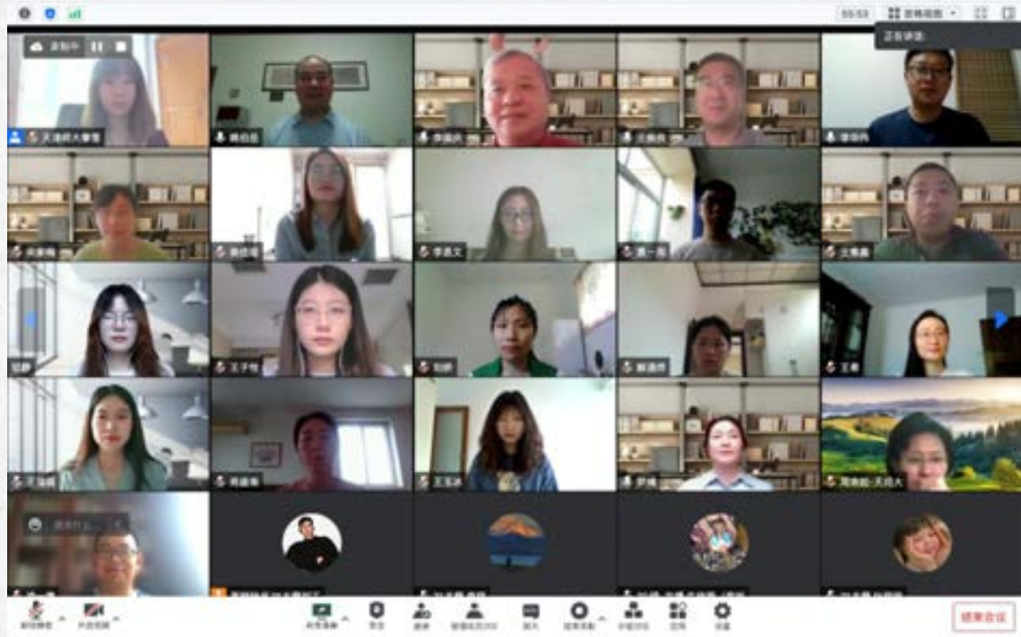
5月19日历史文化学院2022届古籍保护与传播方向硕士研究生毕业论文线上答辩会