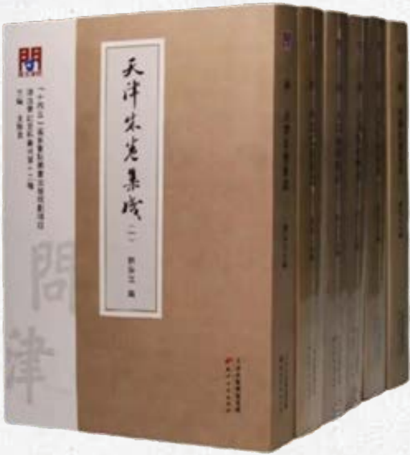
天津朱卷集成（王振良任主编）