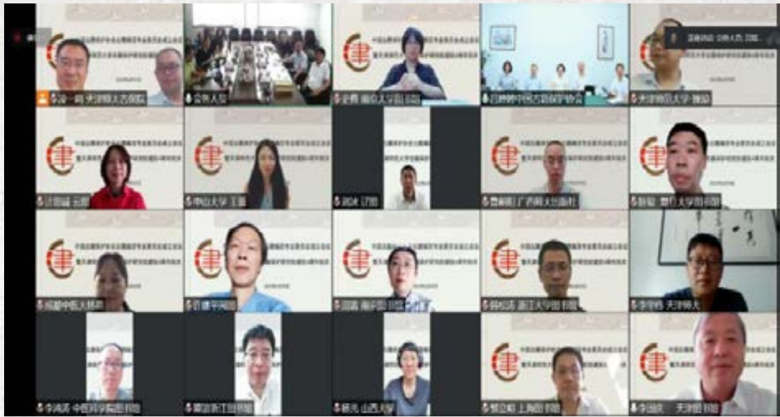
线上参会嘉宾合影