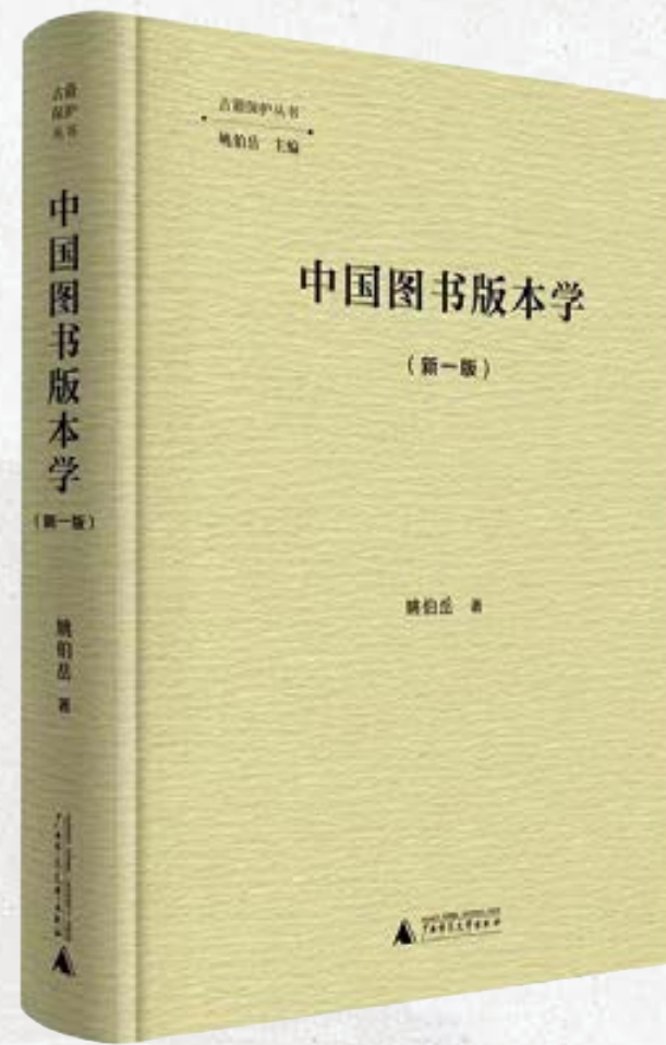
中国图书版本学（姚伯岳著）

[5]朱彦民著.契学初曙:天津甲骨学论集[M].天津:天津社会科学院出版社,2022.（王振良任主编）