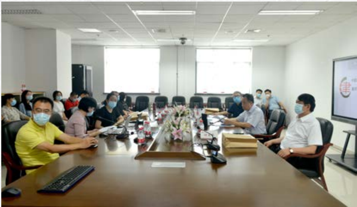
天津师范大学分会场