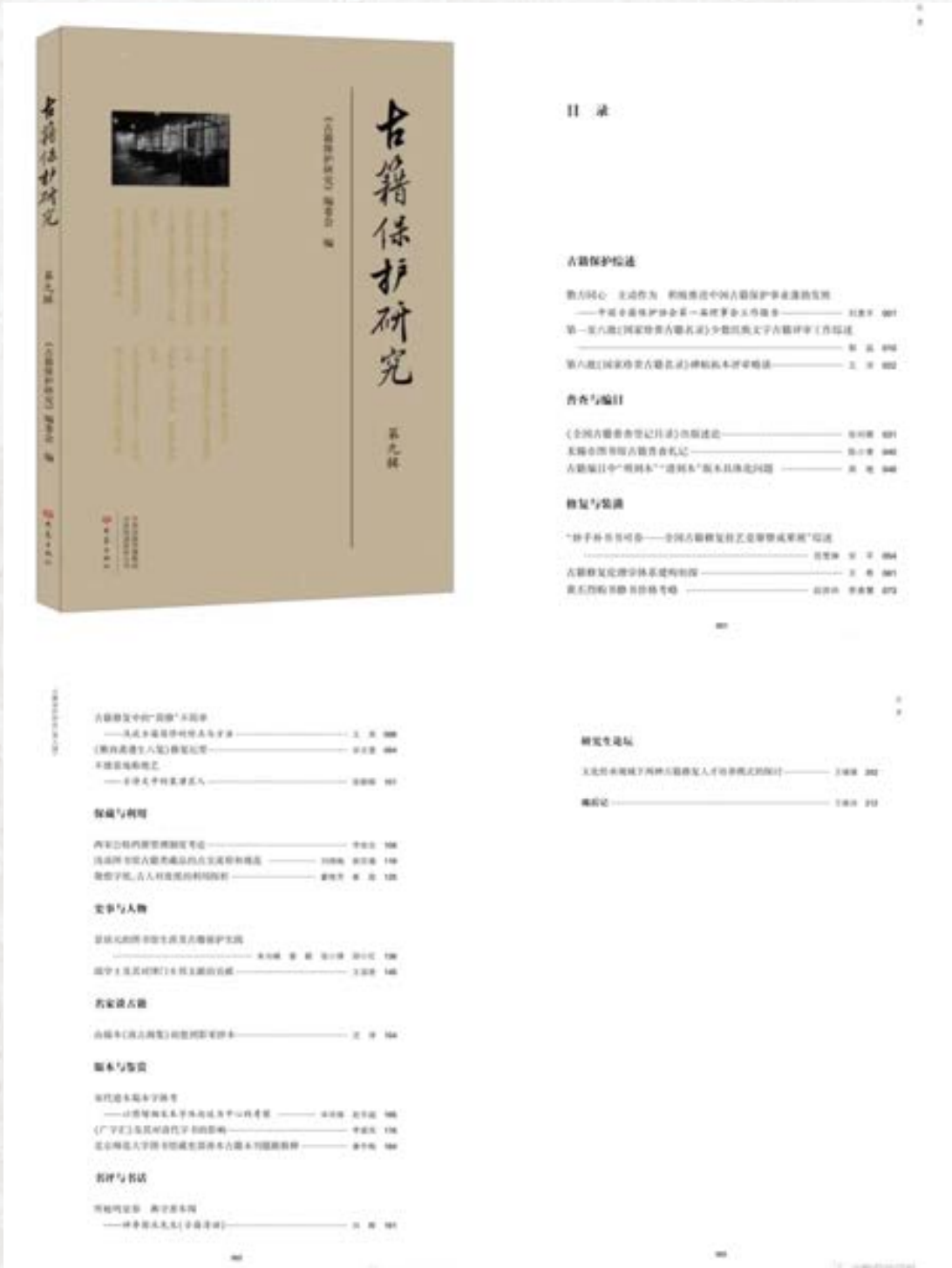
《古籍保护研究》（第九辑）封面及目录

2022年，《古籍保护研究》编辑部积极开展工作，第九辑顺利出版，第十辑稿件已交出版社出版。