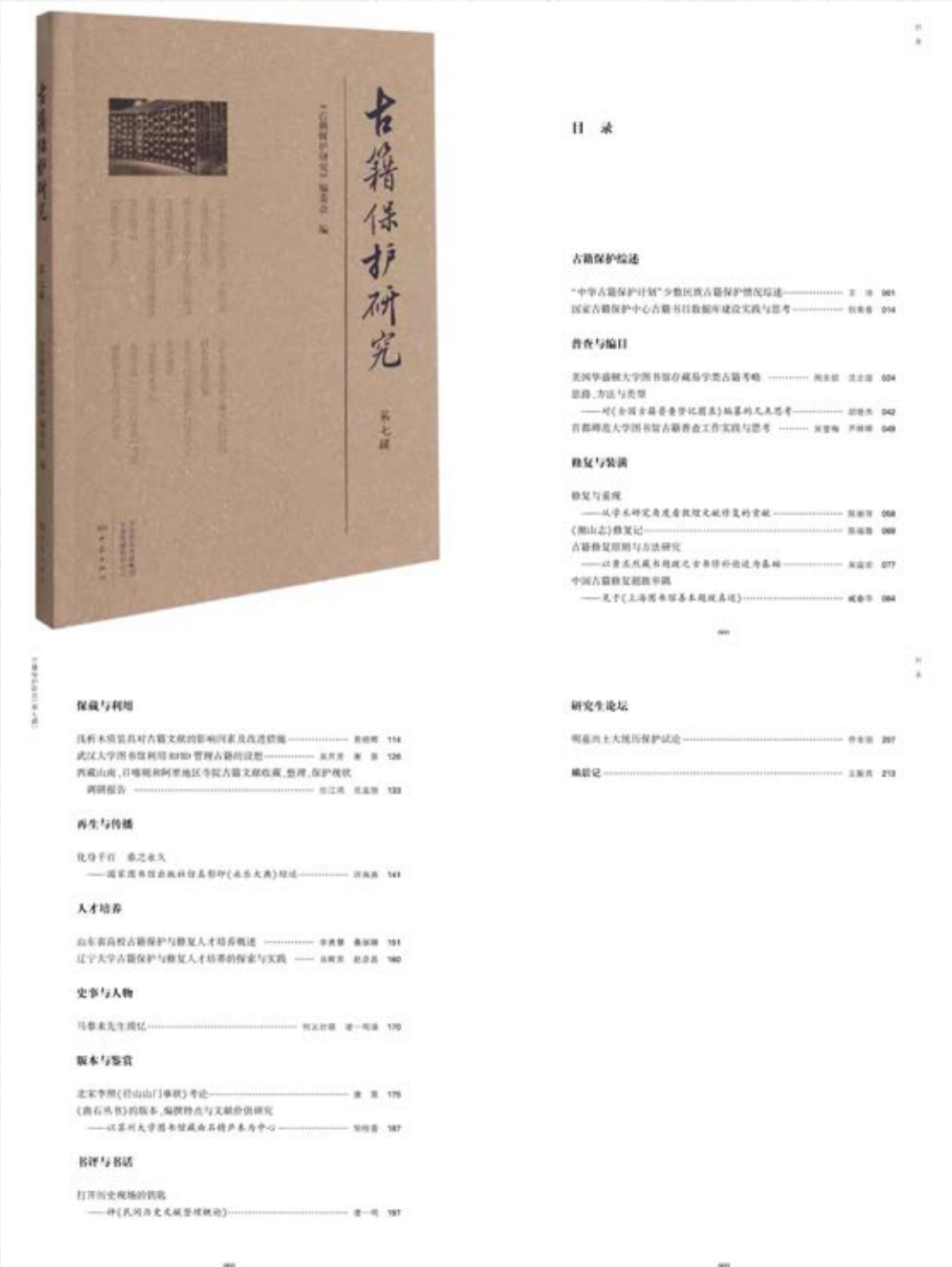
《古籍保护研究》（第七辑）封面及目录

2021年,《古籍保护研究》编辑部积极开展工作,第七辑和第八辑顺利出版,第九辑编辑完成,已送交出版社,将于2022年4月出版。