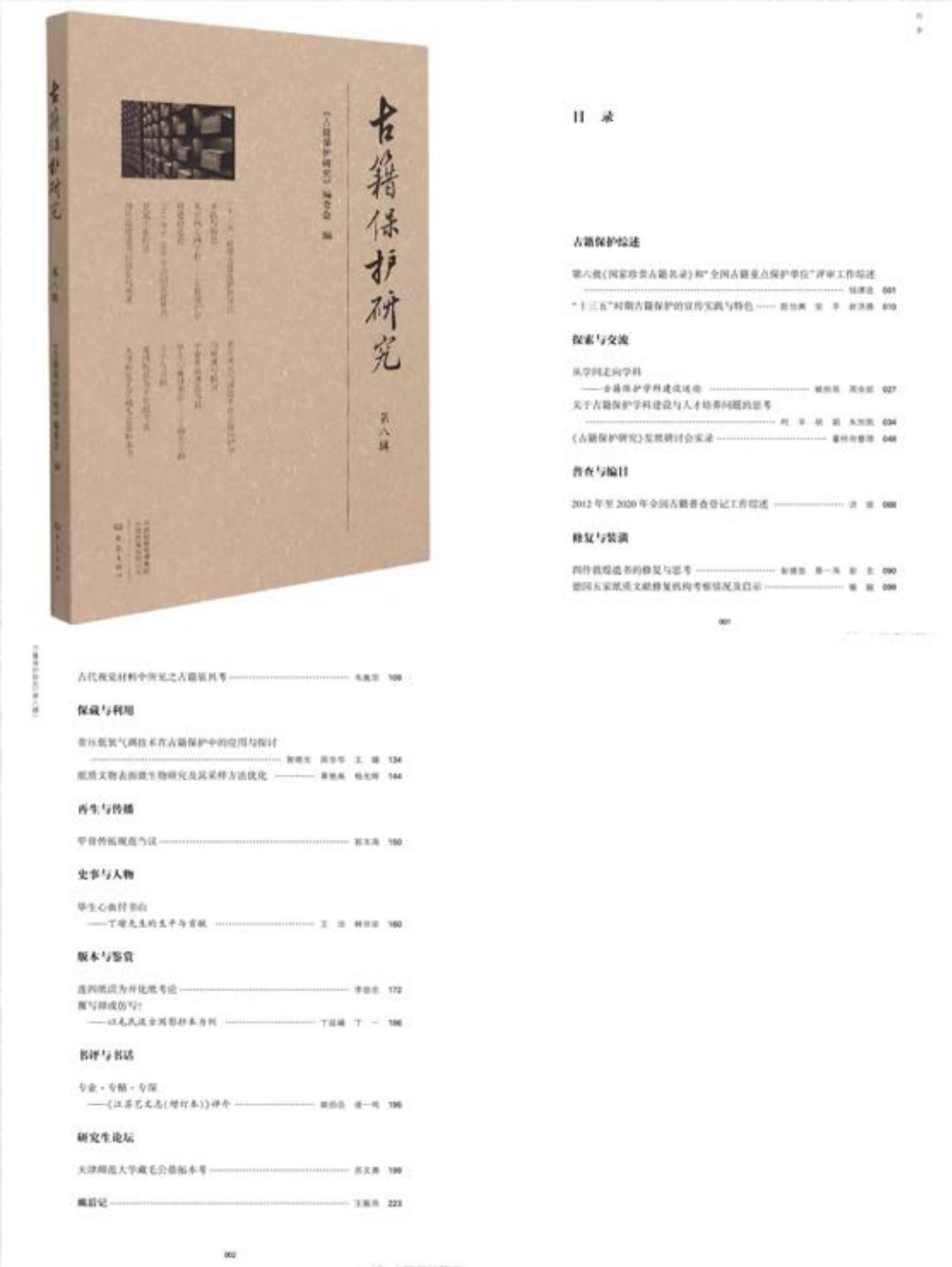
《古籍保护研究》（第八辑）封面及目录