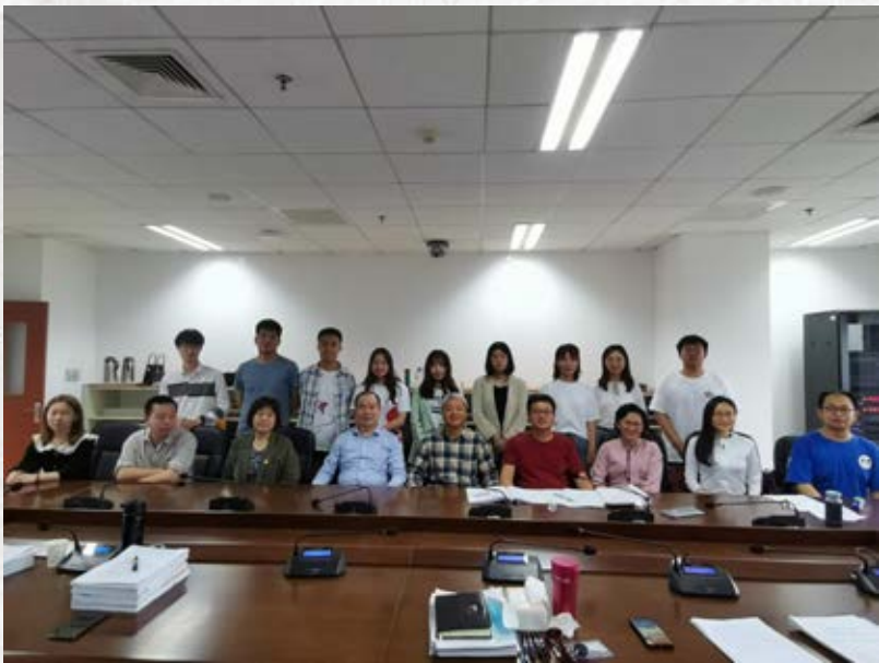
5月14日历史文化学院2021届古籍修复与出版方向硕士研究生毕业论文答辩会