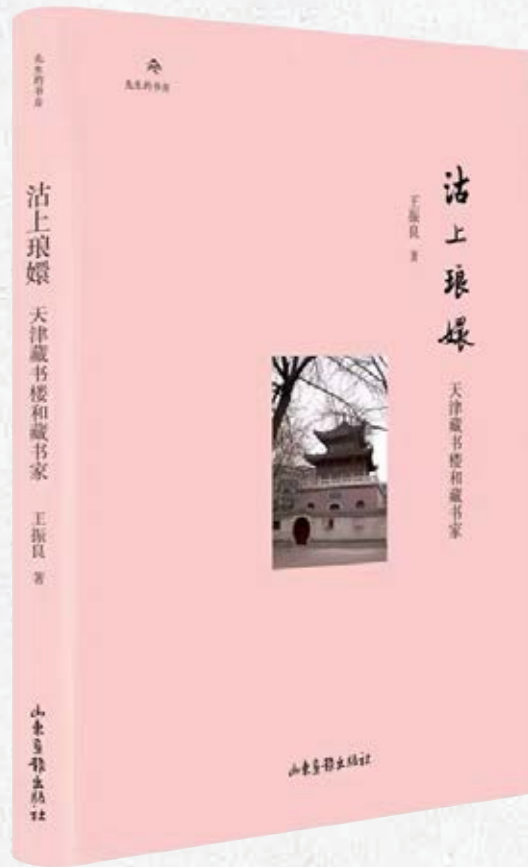
沽上琅嬛——天津藏书楼和藏书家（王振良 著）