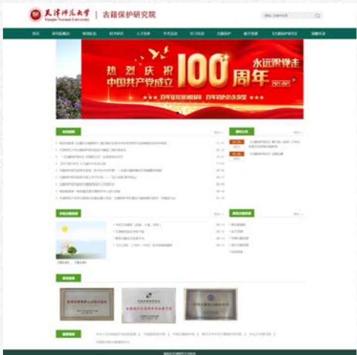
古籍保护研究院新版官网

随着古籍保护研究院的不断发展，网站的关注度和访问量较之2020年有进一步提升。2021年累计访问量为25071人次，较之上年增加9.71%。网站用户主要浏览我院新闻动态，查找师资信息，以及使用网站推荐的数字资源。