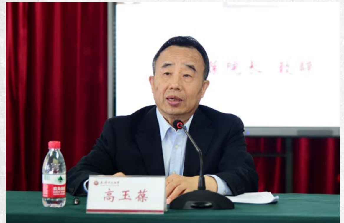
天津市政协副主席、天津师范大学古籍保护研究院院长高玉葆致辞

2021年5月10日上午，以“夯实基础，丰富内涵”为主题的天津师范大学古籍保护研究院建院三周年恳谈会在校图书信息中心10楼报告厅举行。天津市政协副主席、天津师范大学古籍保护研究院院长高玉葆出席会议并致辞，他认为古籍保护是党和国家从增强国家文化软实力、建设社会主义文化强国、坚定文化自信的高度而进行的顶层设计和战略部署，是我国长期坚持的重大国策，如今，“保护古籍，传承文明”已然成为全社会的共识，这其中包含了天师大古保院全体师生付出的努力与汗水，对研究院的前景充满希望和信心。天津师范大学校长、古籍保护研究院综合管理委员会主任钟英华发表讲话，他首先对古保院成立三周年表示祝贺，对古保院建院以来尤其是最近一年在教学、科研、人才培养、对外交流等方面取得的突出成绩表示充分肯定，认为古保院虽然历史很短，但在各方的共同努力下已然成为天津师范大学的一张靓丽名片，学校将继续不遗余力地加大支持力度。