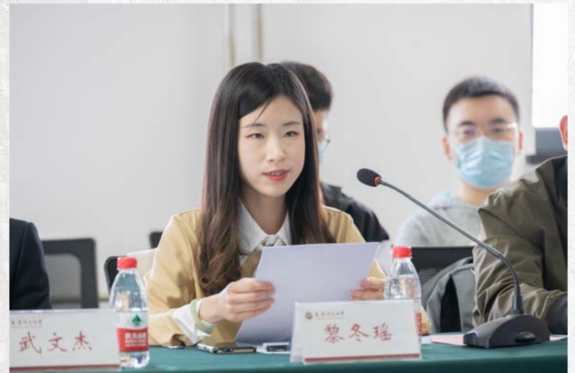
毕业学生代表发言