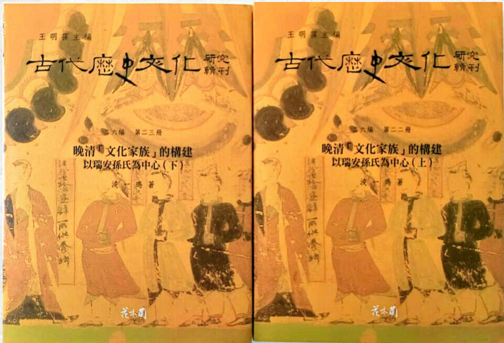
晚清文化家族的构建——以瑞安孙氏为中心（凌一鸣 著）